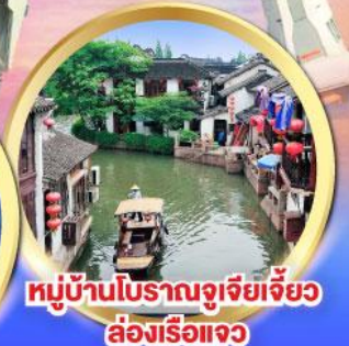
หมู่บ้านโบราณจูเจียเจี้ยว ล่องเรือแจว