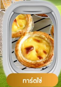
ทาร์ตไข่