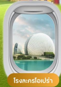
โรงละครโอเปร่า