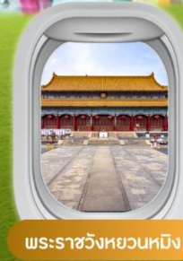
พระราชวังหยวนหมิง