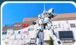
ห้างไดเวอร์ซิตี