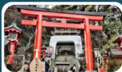
ศาลเจ้าอิเนะชิมะ