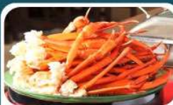
ชาบูบุฟเฟ่ต์