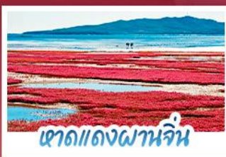
หาดแดงผานจีน