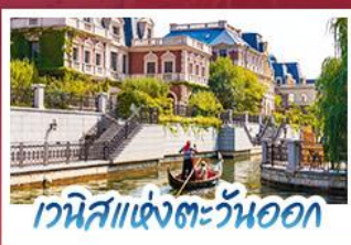
เวนิสแห่งตะวันออก