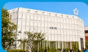
บูรักลินเกาหลี