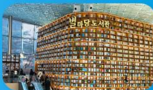
ห้องสมุดสตาร์ฟิลา

เก็บทุกไอศกรีม ในกรุงโซล ตั้งแต่ความงดงามของ พระราชวังเคียงบ็อก ชมวิวสุดอลังการที่ ดักลึอดเค้ โซลสกาย (รวมค่าลิฟต์ขึ้นตึก) สนุกสุดมันส์ที่ สวนสนุกลึอดเค้ เวิร์ด (รวมค่าบัตรเครื่องเล่น) เพลิดเพลินไปกับโลกใต้ทะเล ลึอดเค้ อควาเรียม (รวมค่าบัตรเข้าชม) เช็กอินแลนด์มาร์กสุดฮิตอย่างห้องสมุดสตาร์ฟิลา โกเอกมอลล์ เดินเล่นย่านฮิป บูรักลินเกาหลี ของชูด และช้อปปิ้งซัมเมอร์เซล สุดฟิน ย่านเมียงดงและองแด