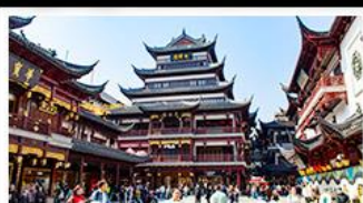
ตลาดร้อยปีเฉิงหวงเมี่ย