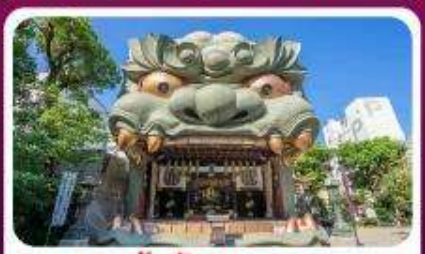
ศาลเจ้านิมมะ ยาชากะ