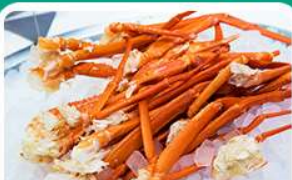
พิเศษ! บุฟเฟ่ต์ขาปู