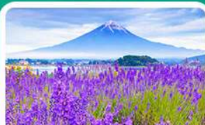
สวนโออิชิปาร์ค