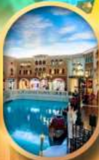
เดอะเวนิเซียน