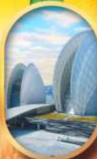
โรงละครไข่มุก