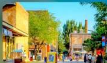
798 Art District