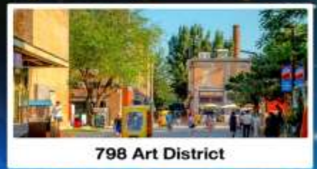
798 Art District