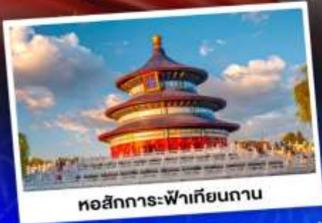
หอสังเกตการณ์เทียนถาน