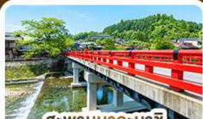
สะพานนากะบาชิ ทาดายาม่า