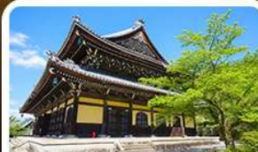
วัดนันเซ็นจิ