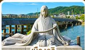
เมืองอิจิ สวรรค์คนรักชาเขียว