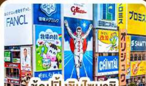
ช้อปปิ้งชินไซบาชิ และโดตงโบริ