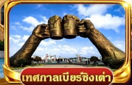
เทศกาลเบียร์ชิงเต่า