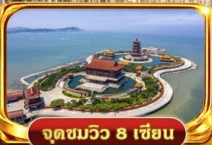
จุดชมวิว 8 เชียง