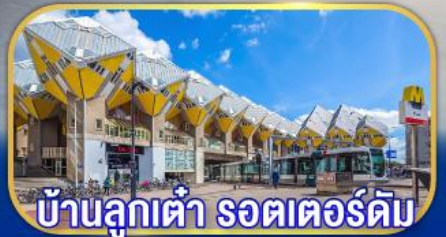
บ้านลูกเต่า รถเตอร์ดัม

เยือนเมืองเก่าแก่ยุโรป ทั่วมหาสมุทรแอตแลนติก กับการบินไทย บินตรงอัมสเตอร์ดัม