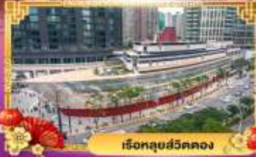
เรือลู่สวีตคลอง