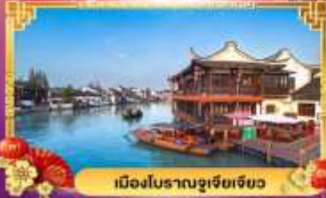
เมืองโบราณซูเจียเจียว