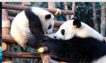
หุบเขาแพนด้าตูเจียงเอี้ยน