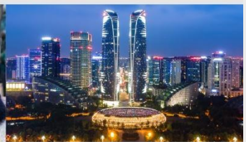
ตึกแฝดเจียงตู

*ทางบริษัทฯ ขอสงวนสิทธิ์ในการสลับโปรแกรมทัวร์ตามความเหมาะสมขึ้นอยู่กับสถานการณ์หน้างาน โดยคำนึงถึงผลประโยชน์ของลูกค้าเป็นสำคัญ