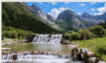
อุทยานแห่งชาติปี่เฟิงโกว