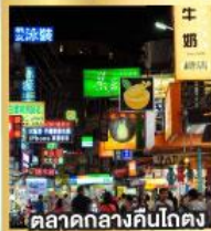
ตลาดกลางคืนโกตง