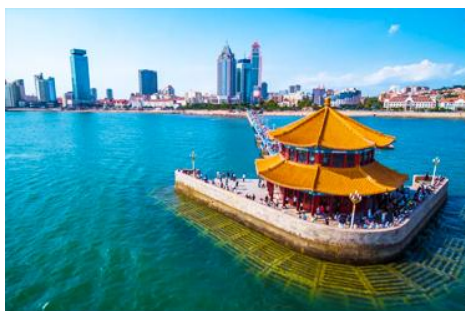
สะพานเทียนเจียว

เช้า รับประทานอาหารเช้า ณ ห้องอาหารของโรงแรม (1)