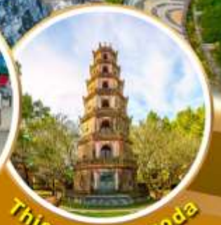
Thien Mu Pagoda