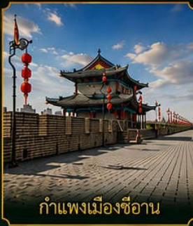
กำแพงเมืองซีอาน