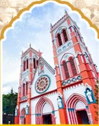
ปอนตีเซอริ้