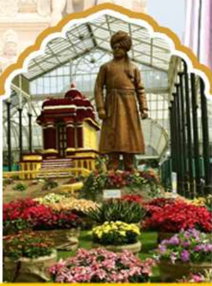
บังกาลออร์