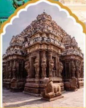
กาญจิปรัม