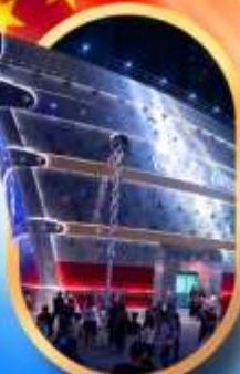
เรือคองฟู