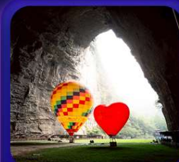
“ ถ้าถึงหลง ”

T2G-CKG29FD ลงชิง เอ็นจือ...ถ้าถึงหลง ล่องเรือมังกรกังสุ่ย ผิงซานแกรนด์แคนยอน 5D 4N (FD)