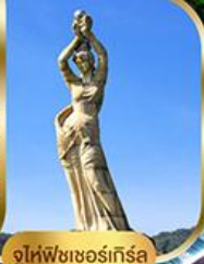
จูไห่ฟิชเชอร์เก็ส