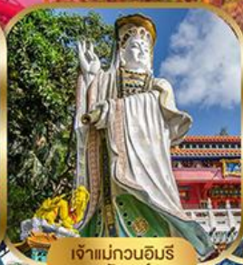
เจ้าแม่กวนอิม พลัสสมัย