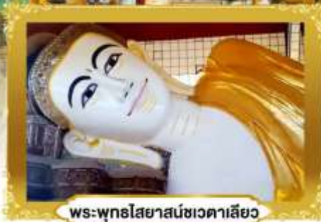
พระพุทธรูปไสยาสน์ชเวดากอง