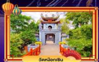
ฝันทสิปัน