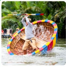
เรือกระดง