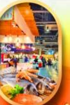
ตลาดปลานิวยอร์ก