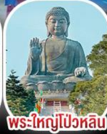
พระใหญ่โป่วหลิน