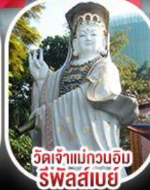
วัดเจ้าแม่กวนอิมริฟลส์เบย์