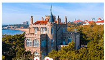
ป่าตึกวน

พระราชวังฤดูร้อน - วิวเมืองซิงเต่า รถไฟความเร็วสูง - ภูเขาเหลาซาน กำแพงเมืองจีนด่านจวิยงกวน - ป่าตึกวน พักโรงแรมระดับ 4 ดาว - ไม่หลงร้านช้อปปิ้ง มือพิเศษ เปิดปักกิ่ง , หม้อไฟซีฟู้ด