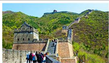
กำแพงเมืองจีนด่านจวิยงกวน