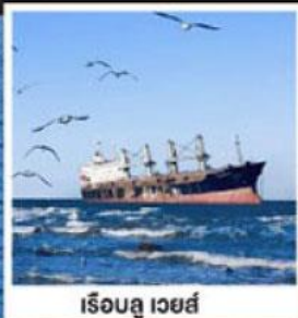
ริเออลู เวย์ส์