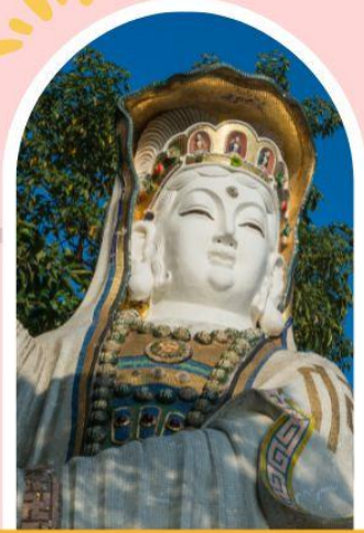
รีพลัสเบย์