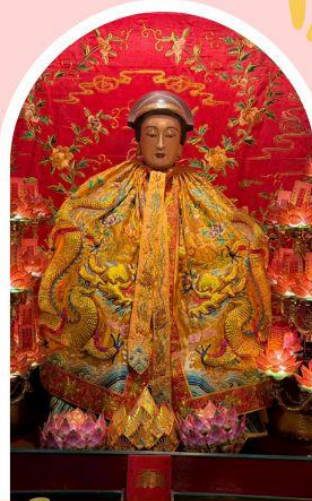
วัดหล่งโหมว

ความสำเร็จ ความมั่งคั่ง เงินทองไหลมาเทมา