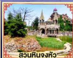
สวนหินจงหลิว