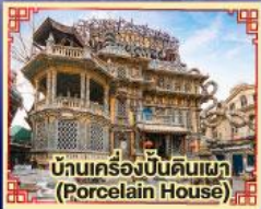
บ้านเครื่องปั้นดินเผา (Porcelain House)