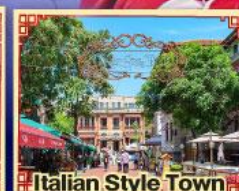
Italian Style Town