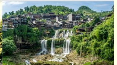
หมู่บ้านโบราณผู่หลงเจิ้น

*ทางบริษัทฯ ขอสงวนสิทธึ้ในการสลับโปรแกรมทัวร์ตามความเหมาะสมขึ้นอยู่กับสถานการณ์หน้างาน โดยค้ำนำ้ถึงผลประโยชน์ของลูกค้ำเป็นสำคัญ