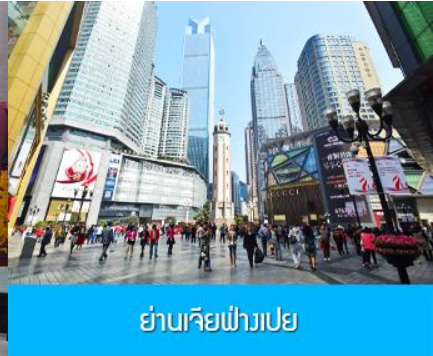
ย่านเจียฟางเปย