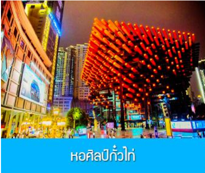
หอศิลป์กั๋วโก๋

นำท่านเก็บภาพที่แสนมหัศจรรย์ ณ สถานีรถไฟลอยฟ้า หลี่จื่อป้า 穿楼轻轨 ชมและเก็บภาพความมหัศจรรย์ของ ขบวนรถไฟที่วิ่งทะลุตัวตึก และจอดเทียบสถานีที่ตั้งอยู่บริเวณชั้นที่ 6-8 ของอาคาร และขบวนรถไฟจะไปทะลุออกอีกด้านหนึ่งของตัวอาคาร พร้อมก็นำท่านนั่งรถไฟทะลุตึก