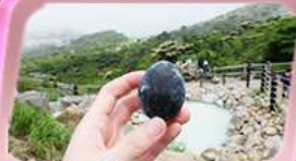
โอวาคุดานิ

พรมสีชมพูผืนใหญ่ที่ฐานฟูจิซัง! เทศกาลซิบะซากุระ: 1 ปีมีครั้งเดียว เปิดประสบการณ์ส่องเรือโจรสลัด ตะลุยหุบเขาโอวาคุดานิ ซิมโซ่ดำ "Unseen" พบพร้อมหัวโซเทเกะ ที่วัดมัตสึจิยาม่า โซเค็น ช้อปปิ้งจัดเต็มย่านดังชินจูกุ และ Gotemba Outlet