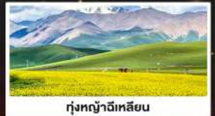
ทุ่งหญ้าฉีเหลียน