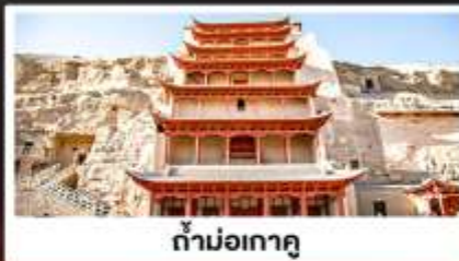
ถ้ำม่อเกาตุ