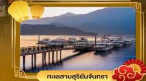
ทะเลสาบสุริยจันทร์