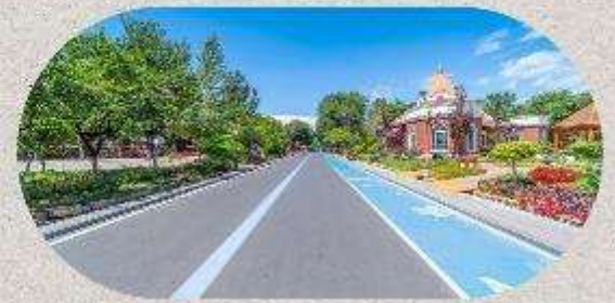
หมู่บ้านโบราณอุยกูร์คางันจิ