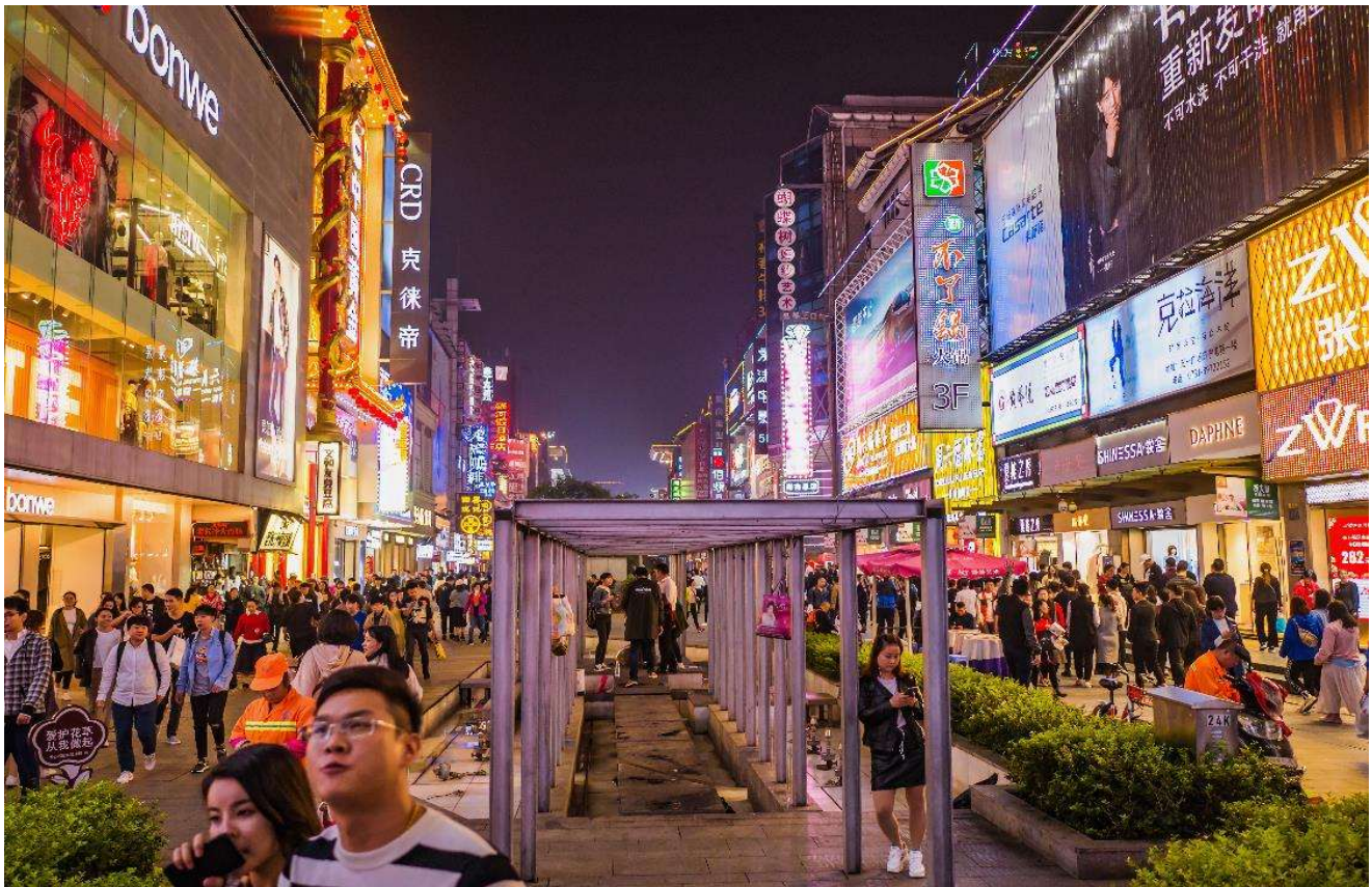
T2G-CSX16SL ZhangJiajie...ฉางซา จางเจียเจีย ฟู่หลงเจิ้น เฟิ่งหวง สะพานแก้ว 6D 5N (SL)