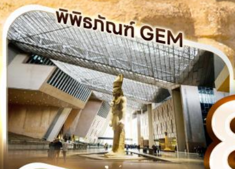
พิพิธภัณฑ์ GEM