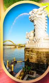
คาร์พดราท้อน