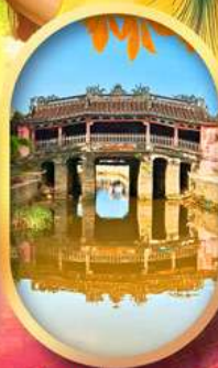
เมืองเก่าฮอยอัน