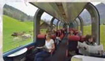
สระผสมเวียดนาม