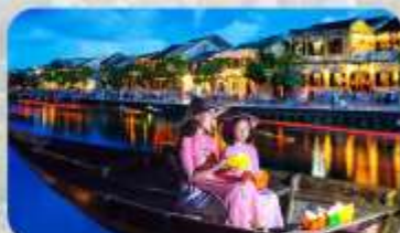
ล่องเรือฮอยอัน