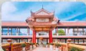
วัดนามเชิน