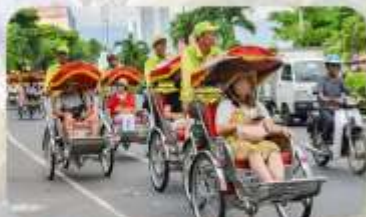
นั่งรถซีโคล่ชมเมืองดานัง