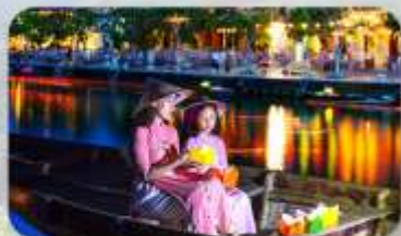
ล่องเรือลอยกระทง