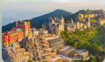
เที่ยวบานาฮิลล์เดิมวัน

TTC HOI AN HOTEL หรือเทียบเท่ามาตรฐานเวียดนาม