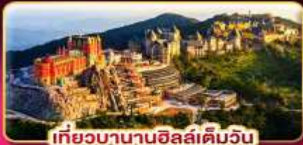
เที่ยวบานาฮิลล์เต็มวัน

ล่องกระทงขามดำคืนที่ฮอยอัน ไฟล์ทสวย บินเช้า-กลับเย็น