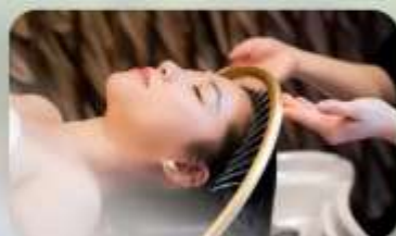
สระผสมสโตร์เวียดนาม