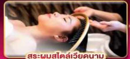
สระผมสไตล์เวียดนาม