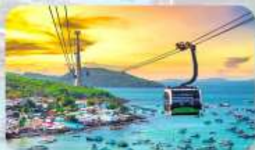
Hon Thom Island