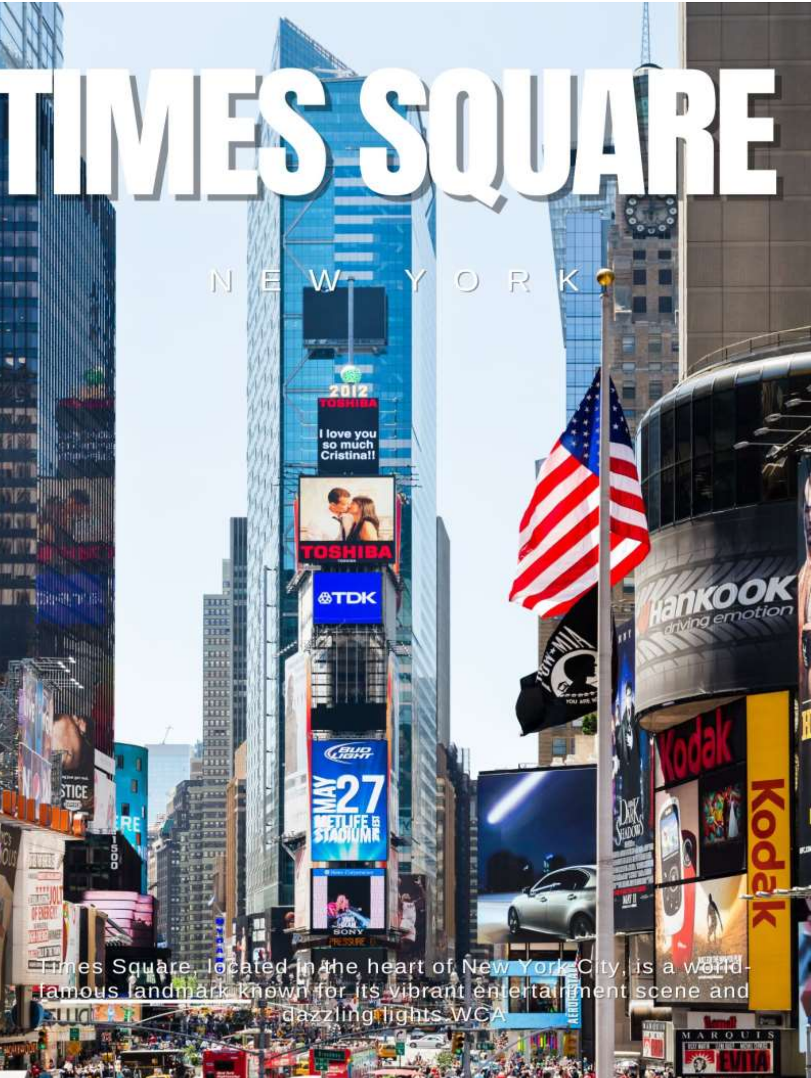
Times Square, located in the heart of New York City, is a world-famous landmark known for its vibrant entertainment scene and dazzling lights. WCA