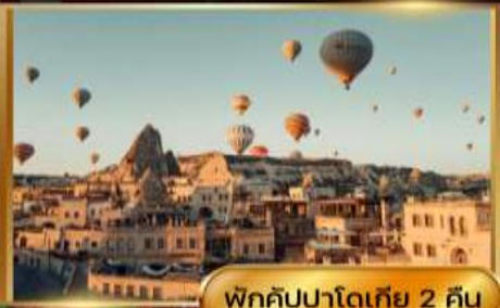
พิกคิปปาโดเกีย 2 คืน