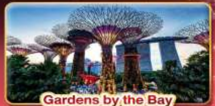
Gardens by the Bay