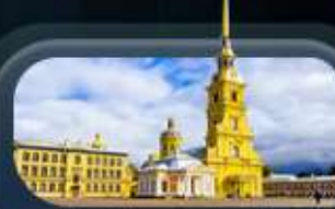
ป้อมปีเตอร์แอนด์ปอล