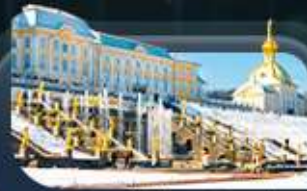
พระราชวังปีเตอร์ฮอฟ