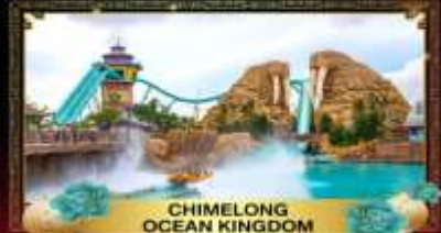
CHIMELONG OCEAN KINGDOM