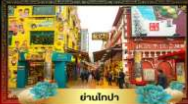
ย่านโกปา